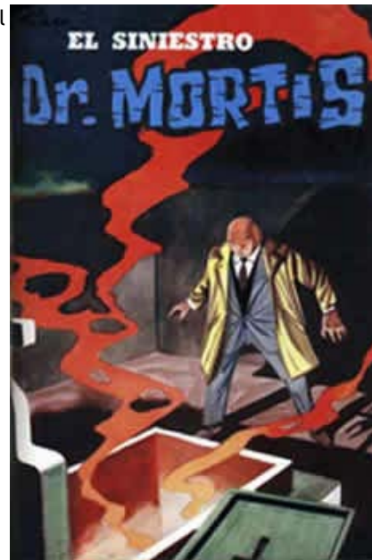
Una de las portadas de la historieta de “El Doctor Mortis”, realizada por Ergocomics

El último homenaje estuvo a cargo de radio Concierto , que durante cuatro fines de semana transmitió el clásico radioteatro que, al igual que en su época de oro, también pudo ser presenciado por el público.